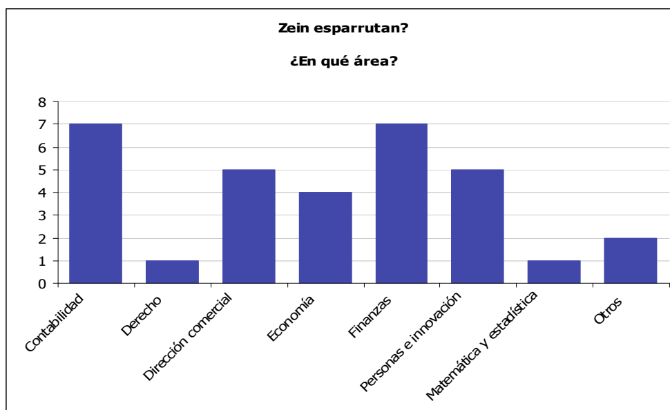
Gráfico 6.3. Áreas de conocimiento en las que pueden ser objeto de estudio la ética, deontología y responsabilidad social corporativa

En línea con las respuestas afirmativas anteriores, el 82% de los profesores ha especificado el área donde ven mayor posibilidad de trabajar alguno de los temas analizados en la encuesta. Destacan las respuestas favorables del área contable y las finanzas donde en ambos casos el 22% de los profesores encuestados afirman poder trabajar en el futuro en el desarrollo de competencias deontológicas, éticas y de responsabilidad social. A su vez, el 16% de los profesores afirman poder hacerlo en el área de la dirección comercial y en temas relacionados con personas e innovación y el 12% en economía. Consideramos que el perfil del profesorado que participa en la encuesta puede condicionar la respuesta sobre el área de aplicación futura, como consecuencia, posiblemente exista una relación directa entre el área de conocimiento de los profesores que han respondido a la encuesta y los datos obtenidos 3 .