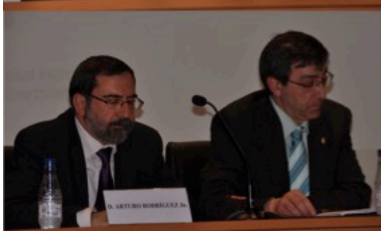
Jornada Inaugural (23/VI/2010)