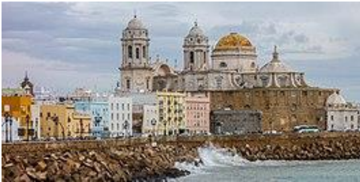
Foto: Vista de la Catedral desde el Campo del Sur, Cádiz

Se cree que Cádiz es la ciudad más antigua de Europa. El emplazamiento de la ciudad de Cádiz es supremo. Es como una lengua que se adentra en la bahía de Cádiz, que forma una península fortificada conectada con tierra firme. Bajo el dominio fenicio se llamaba Gadir. A diferencia de otras ciudades hoy en día, la apariencia de Cádiz sigue siendo antigua, pintoresca pero muy cuidada. Como otras ciudades andaluzas, destaca por su arquitectura morisca, sus calles estrechas y empedradas y la personalidad tranquila del sur. Bajo el nombre de Gadir, que le dieron los fenicios, Cádiz comenzó como un magnífico puesto comercial en el siglo 1100 a. C., comerciando con estaño, plata y ámbar. Posteriormente fue utilizada por los cartagineses convirtiéndola en una concurrida ciudad portuaria. Después de ser reinado por los moros en el siglo XVI, Cádiz comenzó a prosperar como el mejor punto estratégico para hacer negocios con el Nuevo Mundo. Colón navegó desde este punto hacia América en dos de sus viajes. Fue en el siglo XVIII cuando más creció Cádiz. Fue escenario de importantes batallas y situaciones de amenaza como la invasión de Sir Francis Drake o la lucha contra la cercana captura de Napoleón. Unos años más tarde, el gobierno provincial promulgó la Constitución Liberal de 1812, la primera constitución de España. Desde entonces hasta ahora perdura el espíritu liberal y jovial de Cádiz.