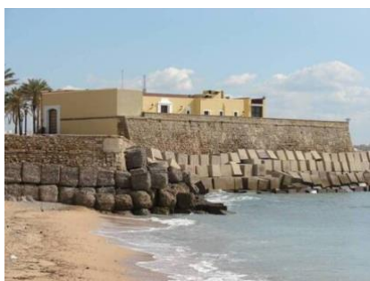
Foto: Baluarte de los Mártires.

La cena tendrá lugar en el Baluarte de los Mártires el día 8 de junio.