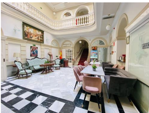
Foto Hotel Las Cortes.

El hotel con el que se ha contactado para albergar y concentrar a los participantes del Congreso, es el Hotel Las Cortes de Cádiz, por su cercanía al Aulario Constitución 1812, y por tener convenio activo con la Universidad de Cádiz. Se ha acordado con el Hotel un 7% de descuento en las reservas realizadas para los congresistas.