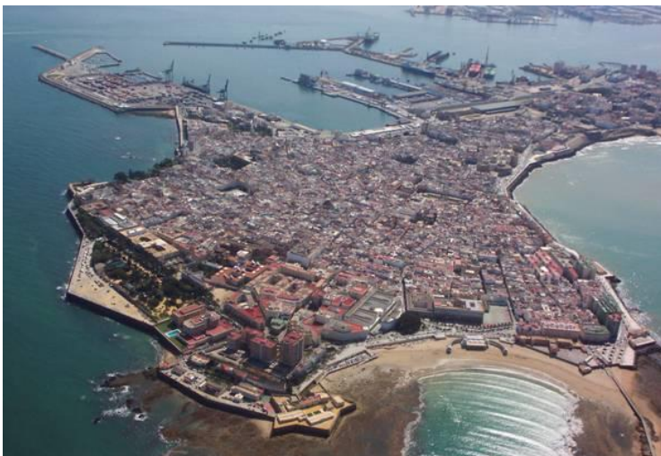
Foto: vista aérea de la ciudad de Cádiz.

Se prevee una visita guiada el día 8 de junio a Cádiz en su casco histórico, para conocer los lugares más emblemáticos y tradicionales de la ciudad, y a aportar al congreso un ingrediente social de convivencia y networking.